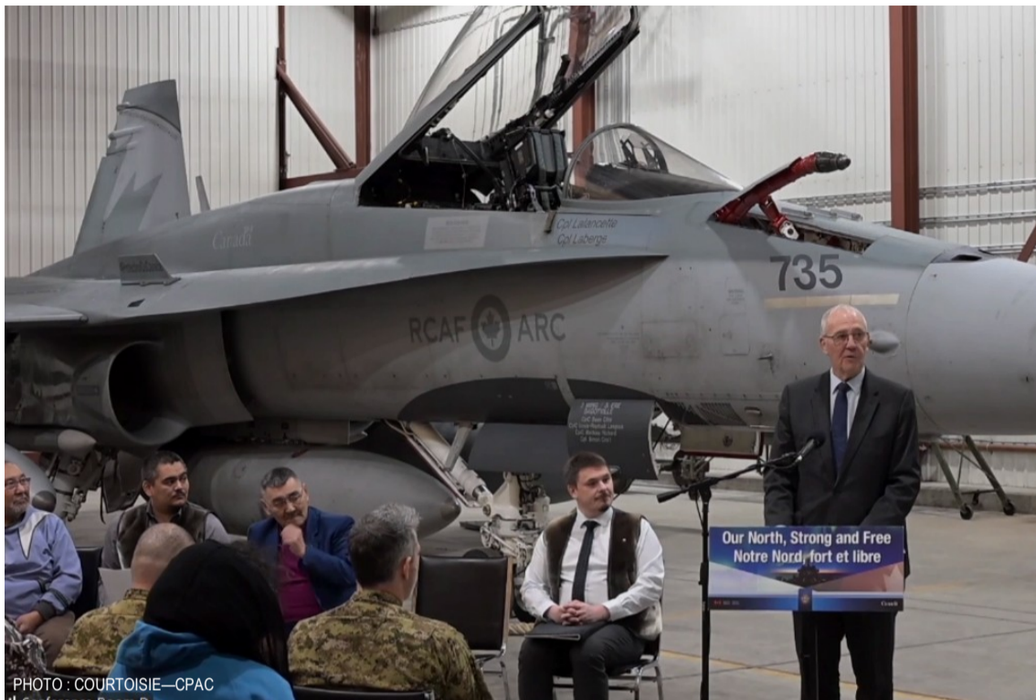
Le ministre de la Défense nationale, Bill Blair, a fait l'annonce en présence des représentants du gouvernement du territoire et des Premières nations à Iqaluit. / National Defence Minister Bill Blair made the announcement in the presence of territorial government and First Nations representatives in Iqaluit.

Ces carrefours constitueront un réseau dispersé de stations