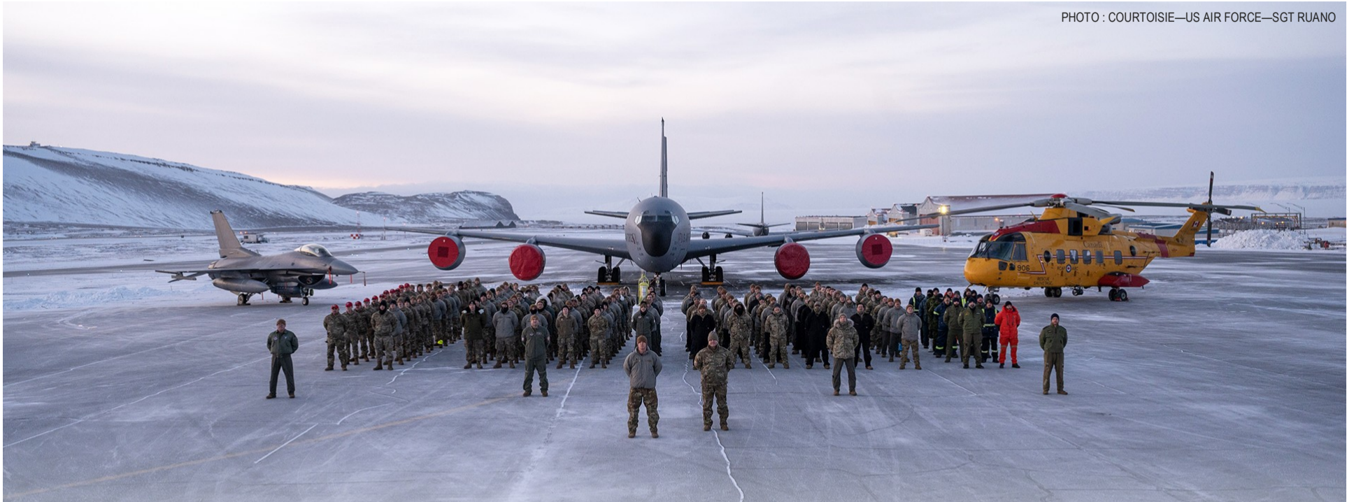
Les militaires du Canada et des États-Unis déployés au Groenland pour NOBLE DEFENDER posent ici à la base de Pituffik. / Canadian and U.S. military personnel deployed to Greenland for NOBLE DEFENDER pose here at the Pituffik base.