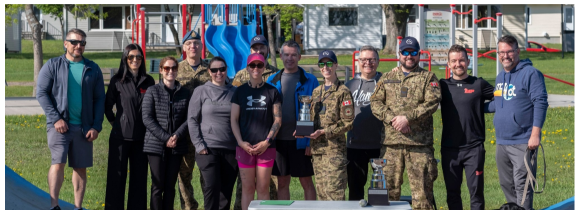
Les deux unités qui se sont distinguées lors du Défi podomètre ont reçu leur trophée le 3 juin lors de la marche de clôture du défi. Les membres du Centre de transition de Bagotville (photo du haut) ont reçu le prix dans la catégorie des petites unités. Pour leur part, les membres du 3 EMA (photo du bas) se sont démarqués dans la catégorie des grandes unités. / The two units that distinguished themselves during the Pedometer Challenge received their trophies on June 3 during the closing march of the challenge. Members of the Bagotville Transition Centre (top photo) received the award in the small unit category. Members of 3 EMA (bottom photo) stood out in the large unit category.